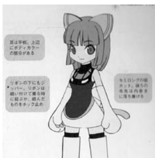
【図6】JR東日本の新幹線用高速試験電車「ファステック360S(E954系電車)」の擬人化。特に「空気抵抗増加装置」とよばれる空カブレーキが「猫耳」に見えるということで、ファンを魅了した。(擬人化たん白書製作委員会編『擬人化たん白書』、アスペクト、平成18〔2006〕年8月、p85)