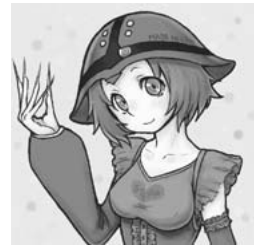
【図 12】「機動戦士ガンダム」に登場するアッガイという兵器（モビルスーツ）の擬人化。現実には存在しないものを擬人化した例。(りると「あっがいたん」、 http://seiga.nicovideo.jp/seiga/im3078548 )