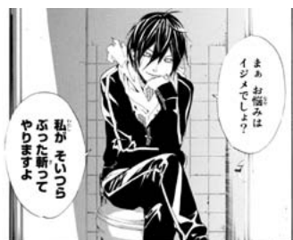
【図 18】同第一巻、平成 23 [2011] 年 7 月、p13