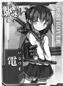
【図2】「艦これ」の登場キャラクター「電」(「艦隊これくしょん-艦これ-攻略 Wiki」、 http://wikiwiki.jp/kancole/?%C5%C5 )

「電」(図2)は、このゲームの開始時に選べるキャラクターの一人(※2)である。「電」の戦闘シーン時の台詞に「沈んだ敵も、出来れば助けたのです…」というものがあるが、これは、艦船としての「電」が昭和一七(一九四二)年のスラバヤ沖海戦において撃沈された重巡「エクセター」の乗員を救助した船史がもとになっている。姿においても、「VIII」というバッチをつけているが、これは「電」が特八型と呼ばれる艦船だったことに由来している。また、青春『青春鉄道』(メディアファクトリー・平成二一(二〇〇九)年)においては、「東海道新幹線」をはじめとした「路線」が擬人化されている。「東海道新幹線」は、元は「特急はと」であったという設定で、高速鉄道であることに自負をもっており(図3) 在来線たちに大柄な態度をとる。これは路線の事実を背景にしているというよりは、鉄道ファンたちのJR東海に対する評価が反映されている。鉄道ファンたちがネット上などで、JR東海に対して営業効率の重視が旅情を奪うものとして批判する行為などがキャラクターに反映されているのである。 このようなキャラクターたちは、「萌え」と呼ばれる要素を反映して