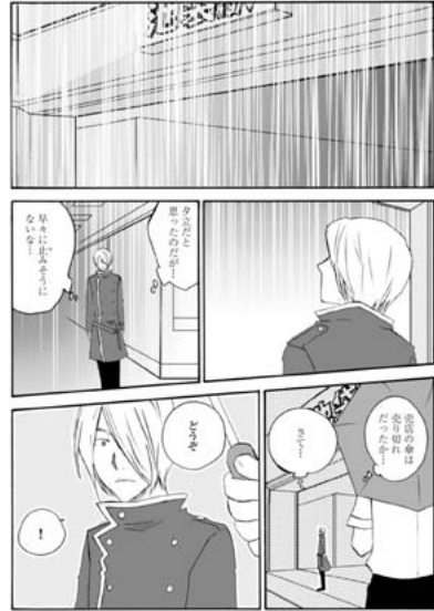
【図21】強気な性格として描かれる西武鉄道。(前掲【図3】と同書、p71・p72)