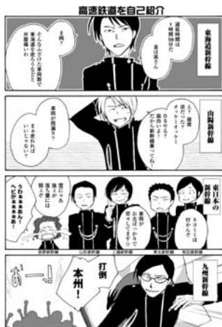
【図3】高速鉄道の擬人化。それぞれの会社に対するイメージなどを擬人化したもの。(青春『青春鉄道』、メディアファクトリー、平成21年[2009]年6月、p95)