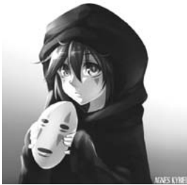
【図 16】Agnes Kyriel 「カオナシ」 http://touch.pixiv.net/member_illust.php?mode=medium&illust_id=50869502