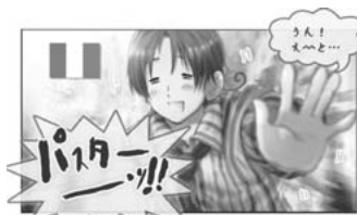
【図7】イタリアの擬人化。(日丸屋秀和『Acis power ヘタリア』、幻冬舎コミックス、平成20〔2008〕年3月、p8)