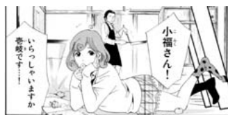
【図 19】同第三巻、平成 24 [2012] 年 2 月、p138

この作品中に出現する神は、主人公の夜ト（ やと ）神という創造上の神以外にも、「天神（菅原道真）」や「貧乏神」、「毘沙門天」をはじめとする七福神など、これまで日本で信仰されてきた神々が多く登場する。とりわけ初期の主人公のライバルとして描かれる「毘沙門天」や、主人公のバックアップ役である「貧乏神」、助言役としての「天神」は出現回数も多く、度々描かれている。例えば「天神」（図 17）は、「三大怨霊」や「左遷」と言われると怒りのあまり雷を落としたり、梅の精を従えていたり、史実に基づく設定がなされている。姿も平安貴族を思わせるものにされており、初期に登場する神の代表格（「天神」）は、主人公以外でもっとも初期に作品中に登場する神）としては主人公（図 18）と対比させる意味でも戦略的な描かれ方をしている。一方で、「小福」という「貧乏神」は、世間一般に考えている姿とは異なり、女性で愛らしい姿であり、「天神」と比べても現代的な姿である。貧乏神であるがゆえ、災厄しかおこせないが（図 19）、それが戦闘上の重要な契機になることもあり、ある意味ではチャームポイントとなっている。