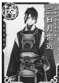
【図8】武器(日本刀)の擬人化。(「刀剣乱舞ONLINE(とらぶ) Wiki」、 http://wikiwiki.jp/toulove/?%BB%B0%C6%FC%B7%E%BD%A1%B6%E1 )

は回収している。こうした「原型」の本性に留まらない、「原型」にまつわるエピソードまでも「擬人化」キャラクターたち