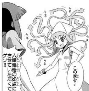
【図9】イカの擬人化。(安部真弘『侵略！イカ娘』、秋田書店、平成20〔2008〕年4月、p6)