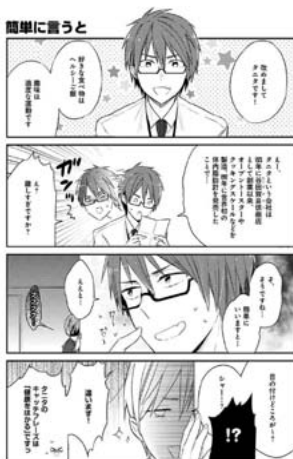
【図10】企業の擬人化。(仁茂田あい『シャープさんとタニタくん@』、pixivコミック、 https://comic.pixiv.net/works/1594 、第3話p2)