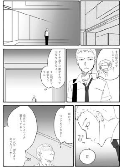
【図 24】実際にトラブルが発生したことで、開業前に示していた軽快な態度を潜めショックを受ける副都心線。人前では明るく振舞いつつも、自分なりに反省するただのお調子者ではない人物として描かれている。(同書、p80)