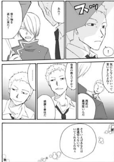
【図 25】相互直通運転においてトラブル時は、乗り入れを中止するのが一般的であるが、西武鉄道は乗り入れを継続した、というエピソードを取りあげている。(同書、p81)