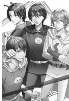
【図 14】AYA「擬人化アンパンマン ポスター用」 http://touch.pixiv.net/member_illust.php?mode=medium&illust_id=53111565