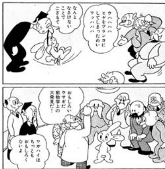
【図1】知能の高い〈耳男〉を改造しようとする科学者たち。（手塚治虫『地底国の怪人』〔角川文庫〕角川書店、平成6〔1994〕年11月、p17）

一方、冒頭に紹介した『艦隊これくしょん——艦これ——』に登場する「艦むす」と呼ばれる艦船を擬人化したキャラクターたちは、それぞれの艦がもつ船史や外見的特徴をその姿に含みつつも、完全な人間として描かれているのが特徴的である。『艦隊これくしょん——艦これ——』のキャラクター