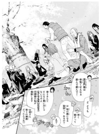
【図20】同第七巻、平成25〔2013〕年6月、p22

東京メトロ副都心線の開業に伴う混乱を作品化した部分（図21）では、相互直通運転を行っている西武鉄道（新宿線） や東武鉄道（東上線）との関係を描いているが、唯一西武鉄道が直通運転を中止しなかったことを、副都心線側が温か みをもって受け入れている描き方は、「才タク的」「腐女子的」創造力によってなされているものと言えよう。