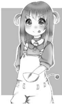
【図 15】なころ「ドラえもん」 http://touch.pixiv.net/member_illust.php?mode=medium&illust_id=57926384