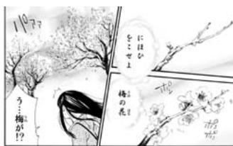
【図 17】あだちとか『ノラガミ』第二巻、講談社、平成 24 [2012] 年 2 月、p20