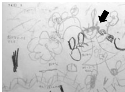
図13 4歳0か月 おはなとつてるところ！おはなせん！！でんしゃのせん！あしあとメリーコーラちゃん

右側の父にバナナを差し出す動作を体幹の向きなどでしめそうとする。父は頭足人で描かれている。バナナを持った手は指まで描かれ、二人を囲んだ円によって注意が集中している。片流れの胴体。