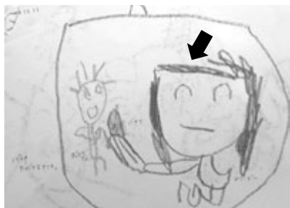
図12 3歳11か月 バナナたべてるところ。おとうさん バナナ メリービー