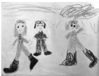
図 17 5歳0か月 〈かっこよかつたしょうぼうしさん〉 みんながようぶくみてるどころ しょうぼうのひと しょうぼうのひと しょうぼうしょのひと

体操着の色、帽子、人物の動作、姿勢とより写実的に描いた。帯空、基底線などは図式的か。