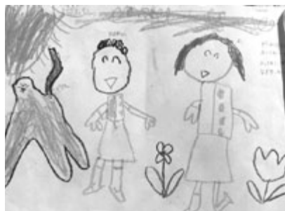
図15 4歳6か月 〈たのしがったえんぞく〉ぞうさん おばあちゃん まこ ぞうさんみてる とこ、おしりね、あのねしっぽと つてもながかったー

女兒らしいリボン、バッグ、ドレスが図式的に描かれているが、バッグにハンドルに腕が通されている様子を描こうとするなど（⇒）紙人形のようなではあるが重なりが描かれはじめている。写実の黎明期への芽生えが観察できる。