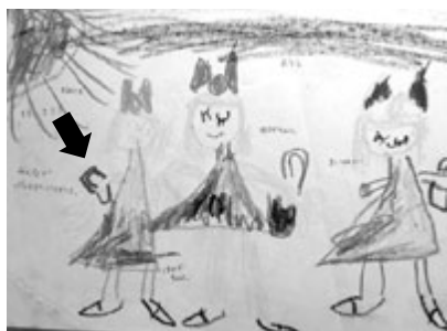
図14 4歳3か月 みんなてバレエにいらるところ。

基底線を思わせる電車の線（線路？）メリーコーラちゃんはじめてこのようなキャラクターに左右対称のスカート様の胴体があらわれた。