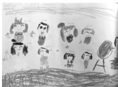
図 18 5歳1か月 〈ドキドキしたおゆうぎがい〉 みんなて楽しいマーチをやっている ところ

ケットなどを描きこんでいる。足もとのブーツ上部の線なども個別に観察して描いている。印象深かったことが想像されるブーツが拡大されて描かれており、図式的といえる。指の爪なども描こうとしている。自分に見えたものを描こうとする視覚的リアリズムの萌芽が確認される作品。