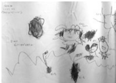
図9 3歳11か月 くうんとこしょどつこいしょ！ まこのはおっきいのがとれたの。おい も かのんちゃん ゆうがちゃん と もくん おひさま

芋ほりについて描いた。太陽と地面の基底線が描かれた。レントゲン描法と見られる地中のサツマイモ。いままでにないこととして足がしっかり描かれて、ボディイメージの発達がかがえる。真ん中の子どもが左側に持った物を差し出すような横向きの動作が表れた。